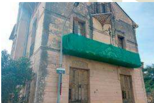
La Torre Iris, al carrer Figueras, conserva impactes de metralla